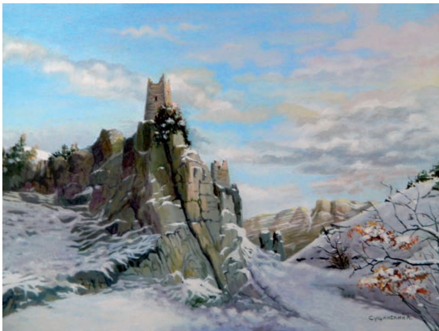
Снежная ретушь в горах Кавказа. Холст, масло (50 × 70)