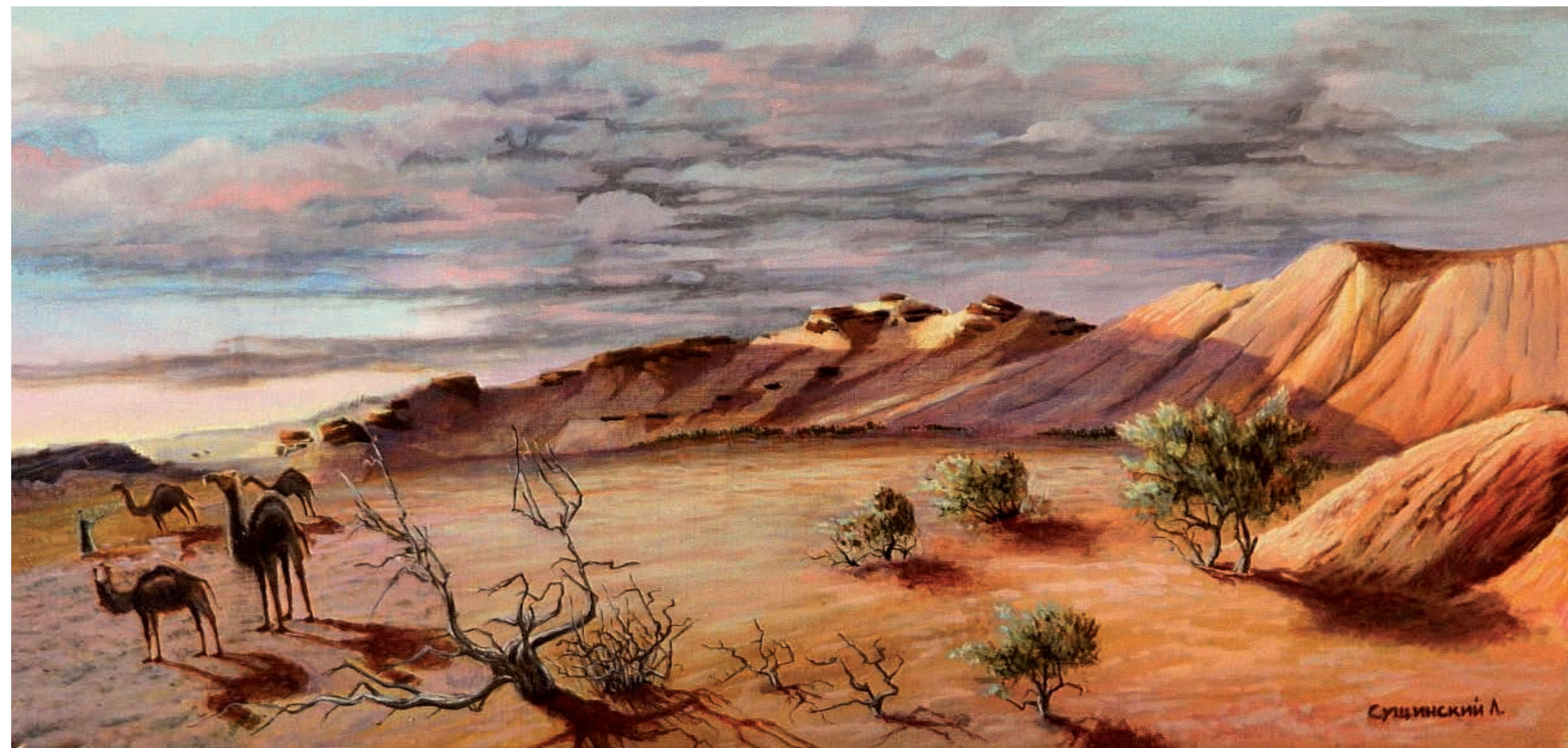
Кызылкум. Мурунтау. Холст, масло (40 × 80)