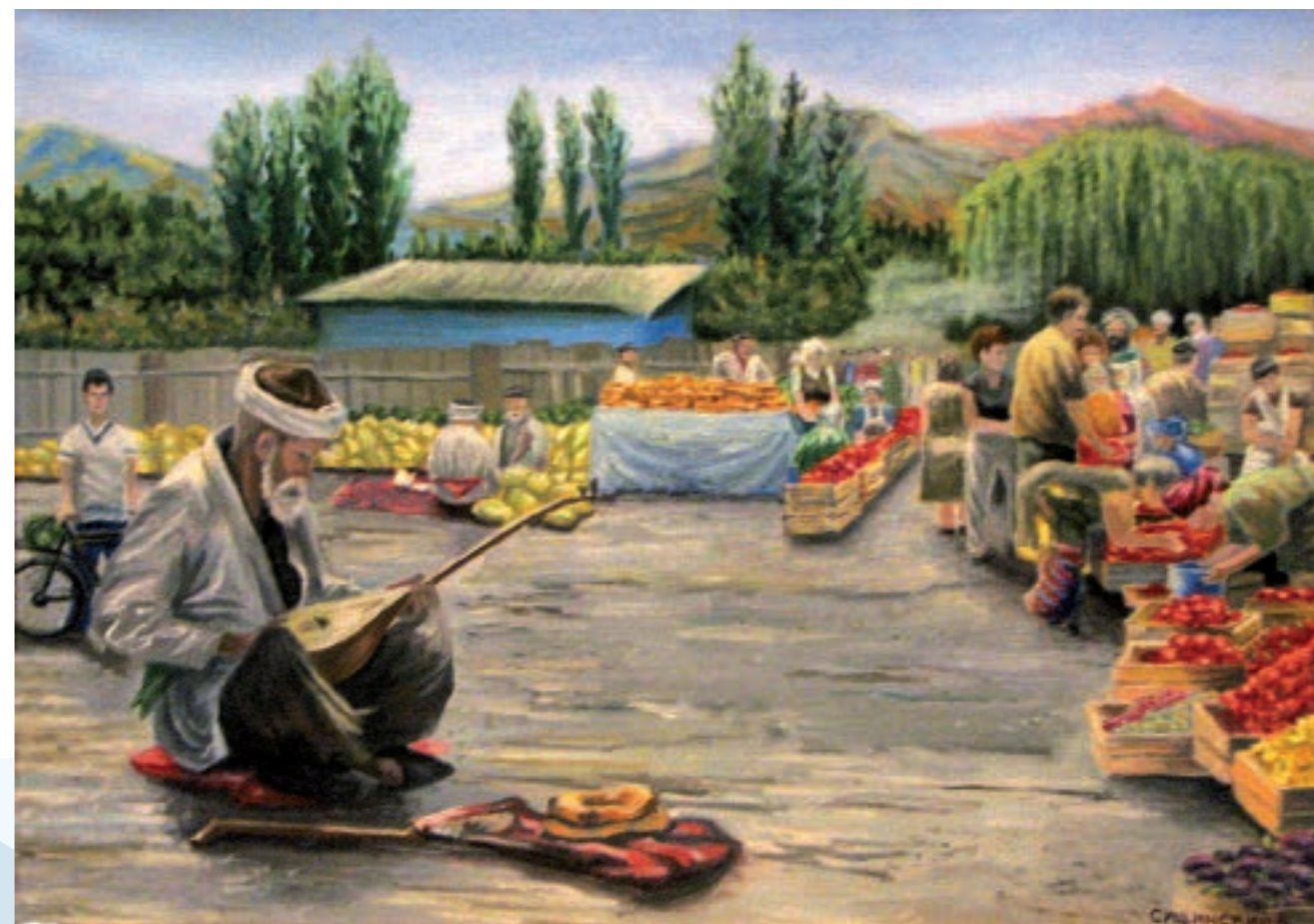
Восточный базар. Холст, масло (50 × 70)