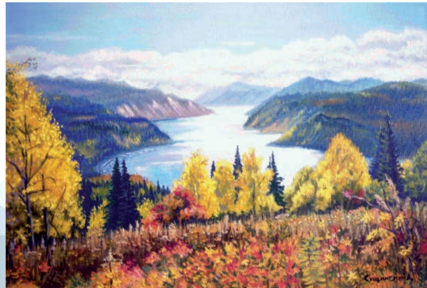
Телецкое озеро. Алтай. Холст, масло (40 × 60)