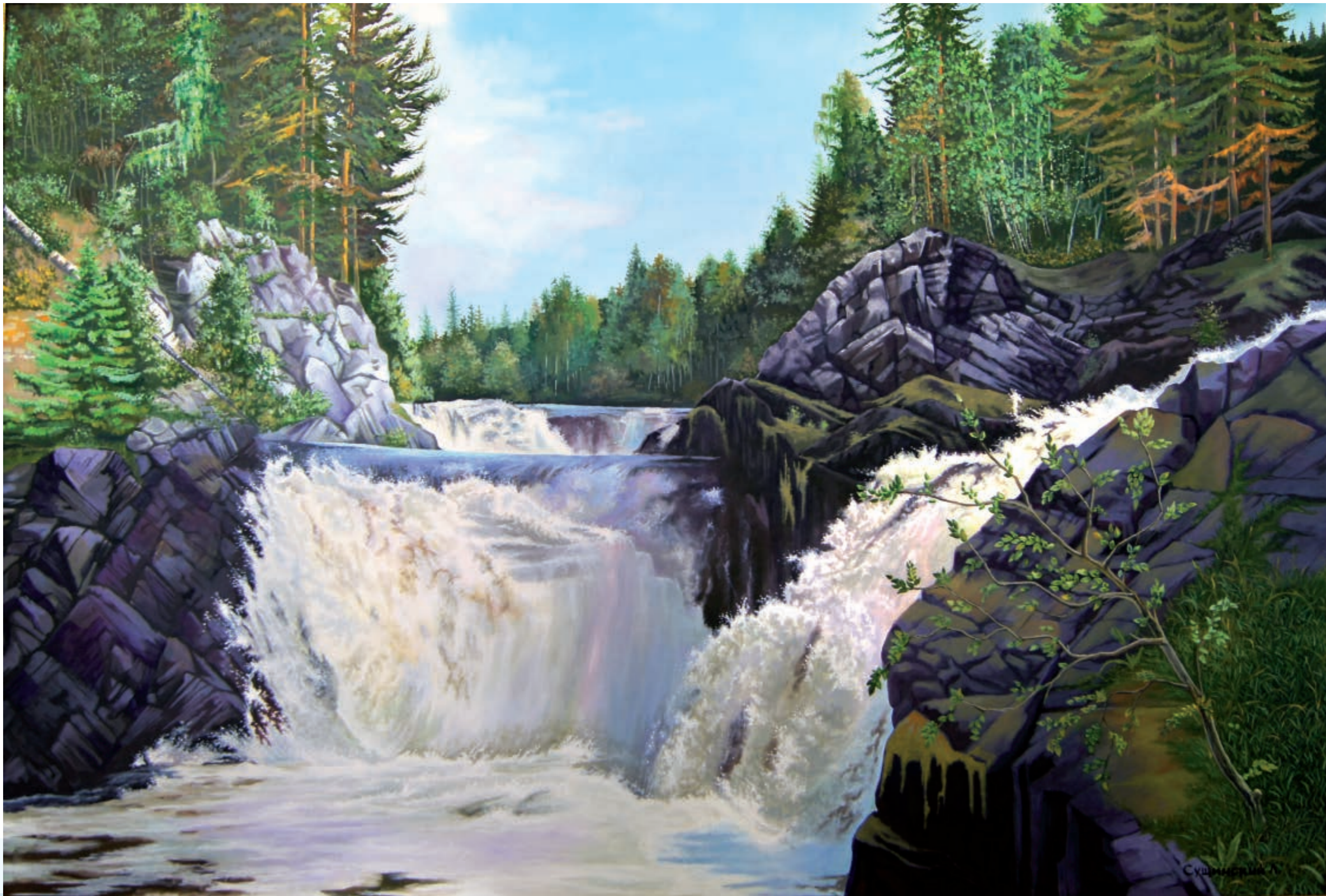
«Они сошлись. Вода и камень...» Холст, масло (120 × 180)