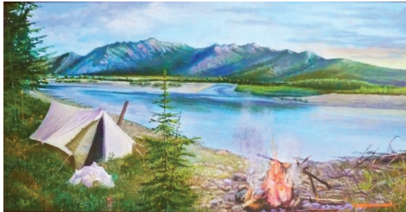
Колымский пейзаж. Холст, масло (40 × 80)