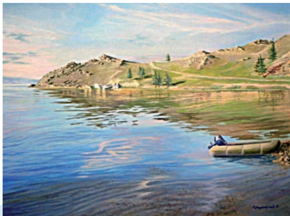
Тихое утро на Байкале. Холст, масло (60 × 80)