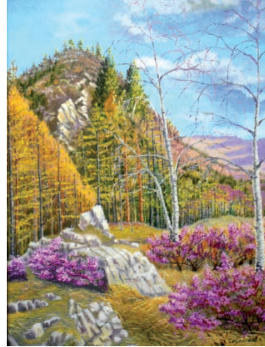
Сопки, багульник. Холст, масло (70 × 50)