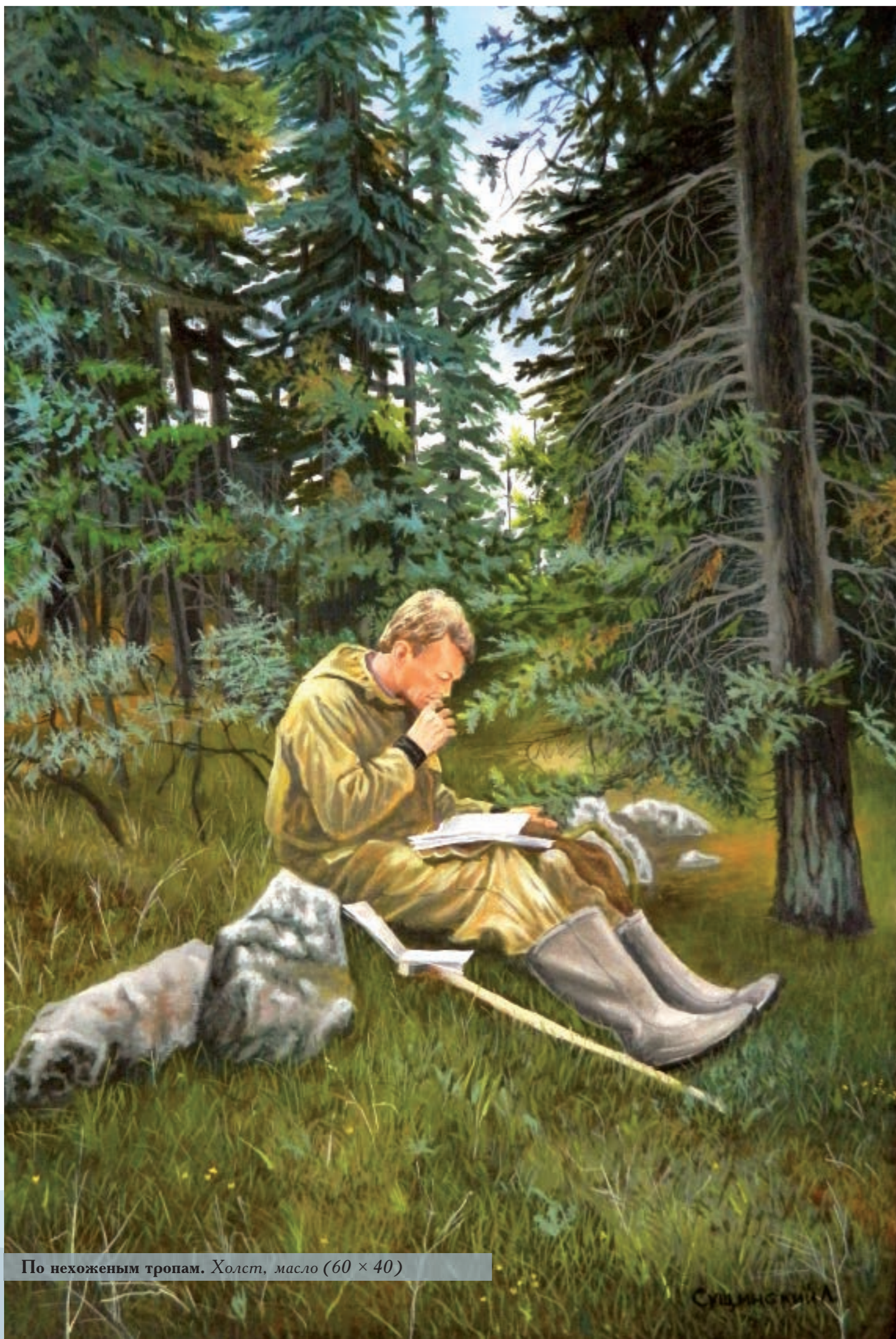
По нехоженным тропам. Холст, масло (60 × 40)